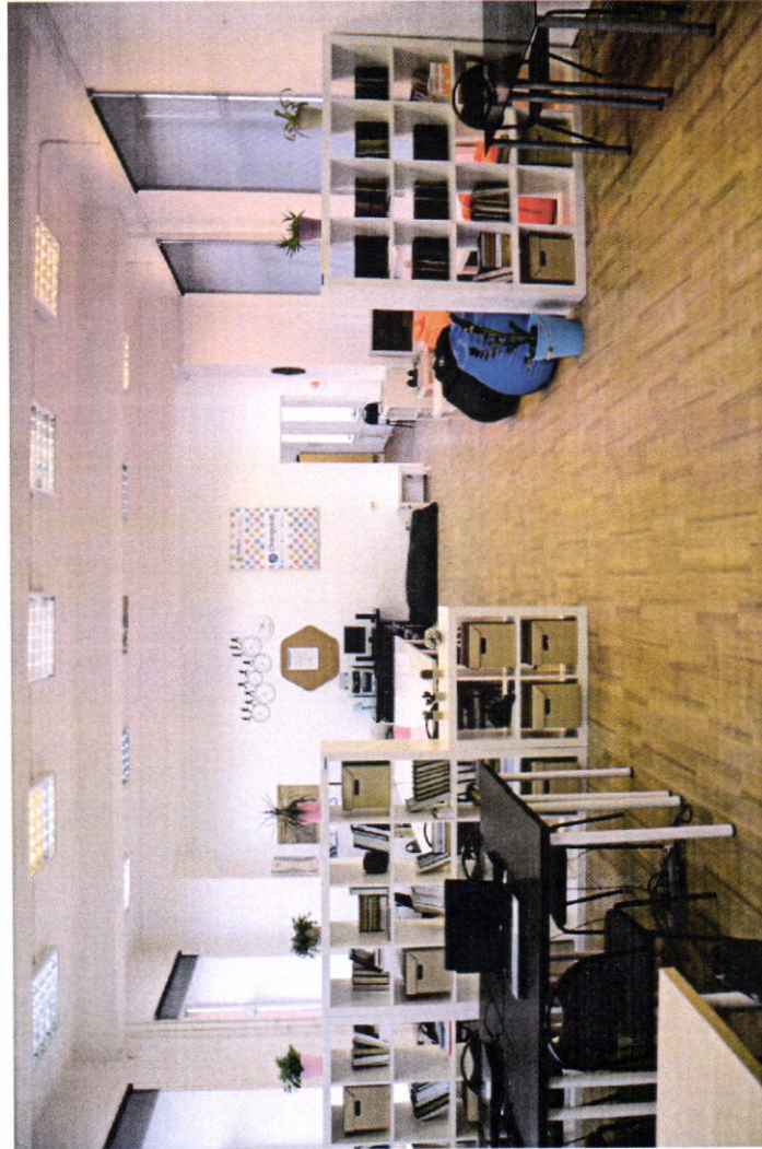
Рисунок 1. Зона формирования цифровых и гуманитарных компетенций, в том числе в рамках предметной области "Технология", "Информатика", "Основы безопасности жизнедеятельности"

центра образования цифрового и гуманитарного профилей в соответствии с брендбуком